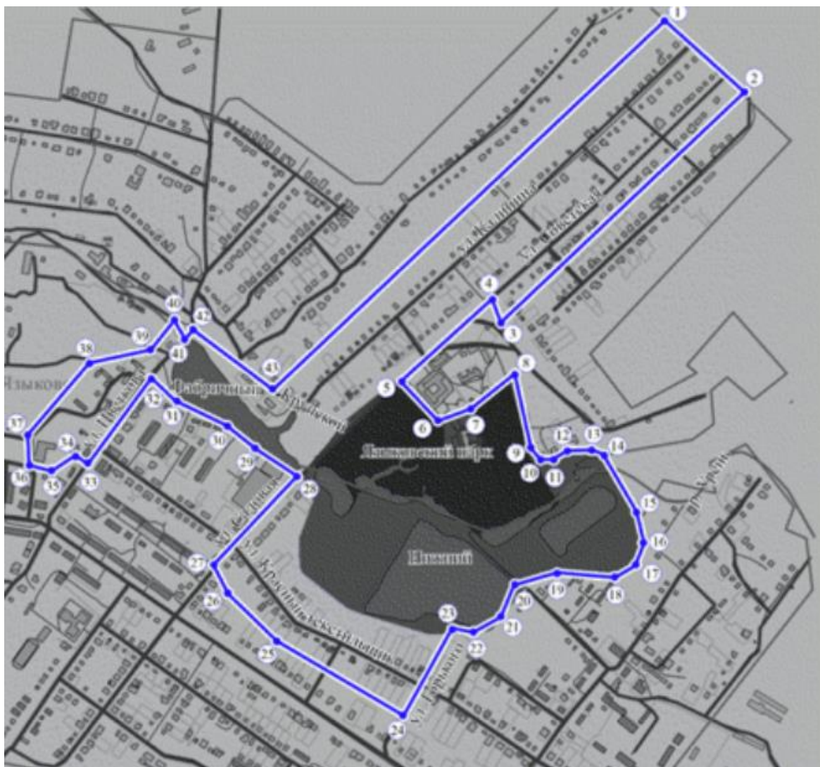
Рисунок 5. Схема границы территории исторического поселения регионального значения рабочий поселок Языково

В границах территории исторического поселения регионального значения рабочий поселок Языково в целях сохранения объектов культурного наследия, выявленных объектов культурного наследия, предмета охраны исторического поселения устанавливается правовой режим использования земель, предусматривающий: