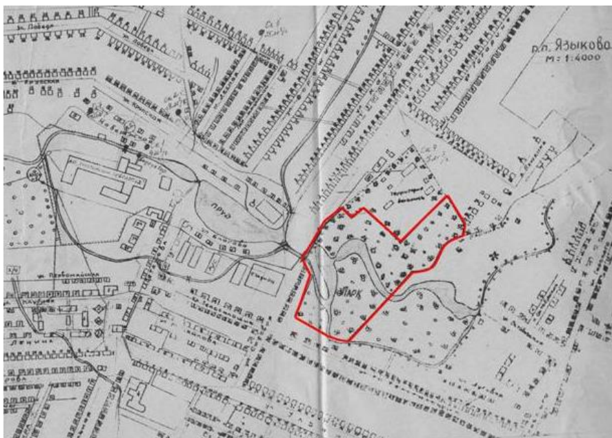
Рисунок 2. Карта-схема расположения памятника природы регионального значения «Языковский парк»

Памятник природы регионального значения «Языковский парк» является особо охраняемой природной территорией регионального значения Ульяновской области и расположен в Карсунском районе в центральной части р. п. Языково. Со всех сторон парк граничит с жилой застройкой р. п. Языково.