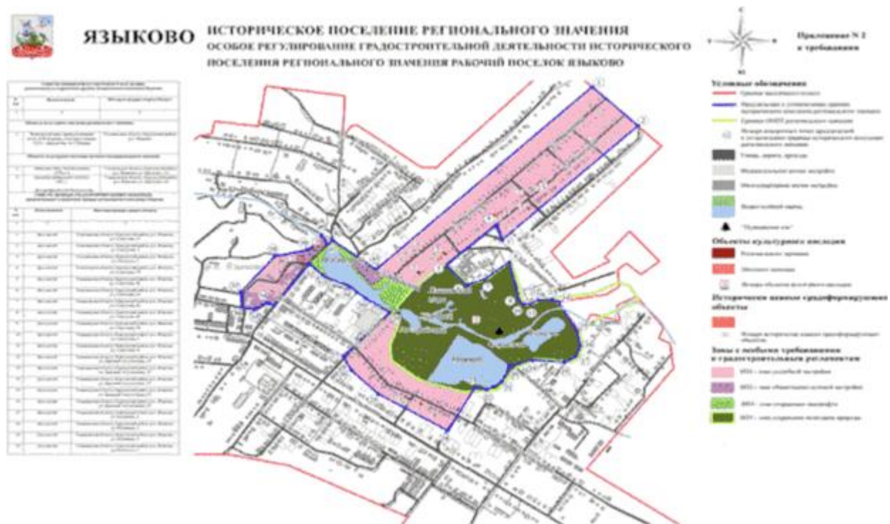
Рисунок 5. Особое регулирование градостроительной деятельности исторического поселения регионального значения рабочий поселок Языково